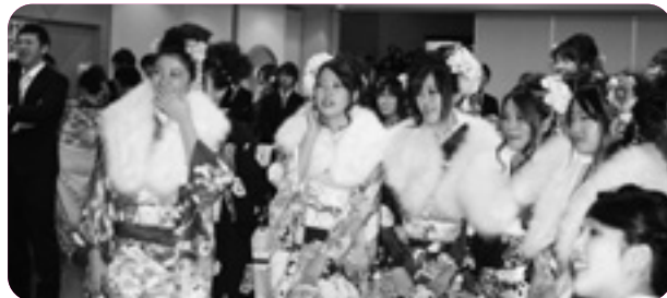
▲スライドショーに見入る新成人のみなさん