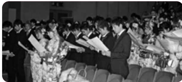
▲粛々と進行した式典