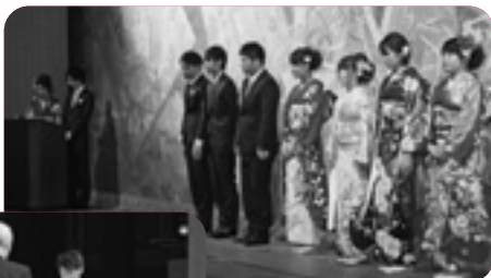
▲成人式運営委員のみなさん