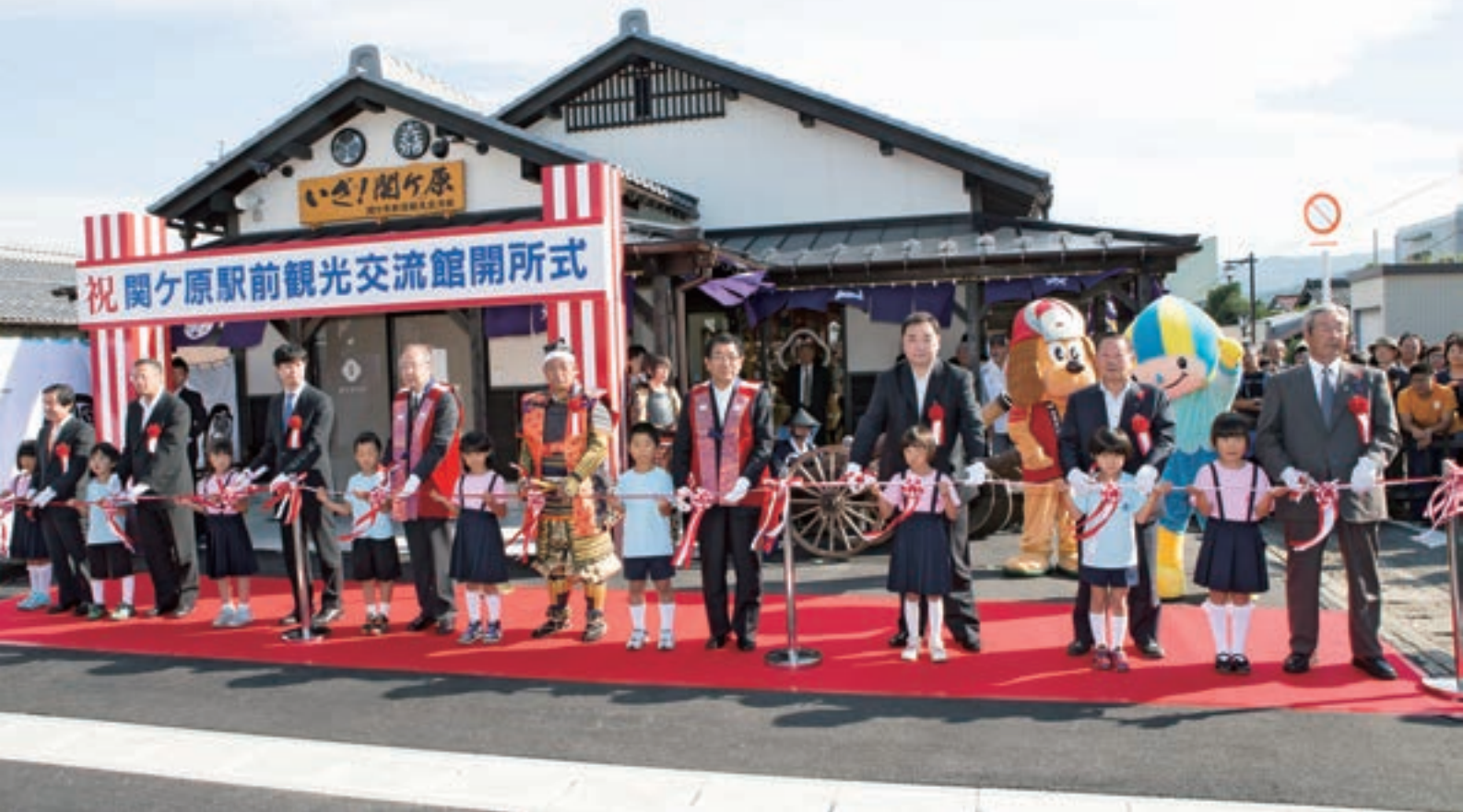
▲関ヶ原駅前観光交流館 開所式