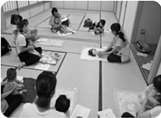
▲ 8月の体験会の様子

生後1ヶ月の赤ちゃんから、歩き始める1歳ごろのお子さんまでが対象ですが、対象年齢に上限はありません。 最近スキンシップが足りないかなと思われる方、ベビーマッサージに興味がある方は、ぜひ、ご参加ください。 なお、予防接種後2日以内のおさんは、参加時にお知らせください。