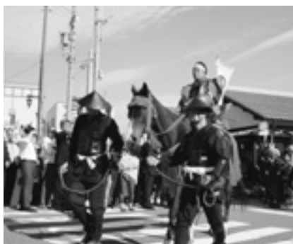
▲7 武将武者行列 (馬に跨がる西脇町長)

七 武将の勇ましい出陣パフォーマンスが披露されたあと、馬に乗った西脇町長を先頭に、武者行列はオープニング会場であるふれあいセンターへと向かいました。