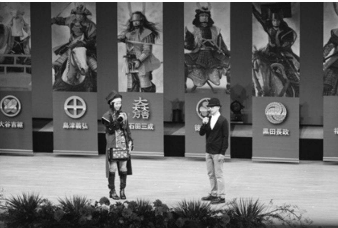
▲7 武将にまつわるトークセッション