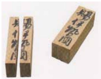
木契(複製) 亀山市博物館

「固関」は、関所の仕事の中で一番緊張する場面です。天皇が崩御された時や都で事件・謀反が起きた時に発せられる「固関」の命令は、数年に一度出されました。