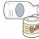
空き瓶 (無色・茶色・その他・一升瓶・ビール瓶)