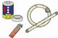
有害ごみ (電池・蛍光灯・ライター)