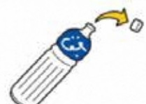
ペットボトル キャップ