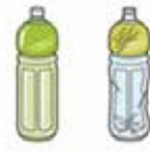
ペットボトル (透明)