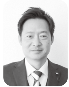
北村 一磨 議員